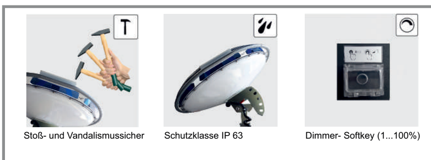
Stoß- und Vandalismussicher