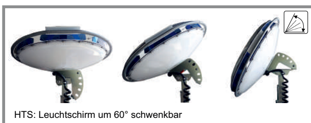
HTS: Leuchtschirm um 60° schwenkbar